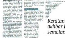
Keratan akhbar BH, semalam.

geri dan Kos Sara Hidup (KPND) serta pihak berkuasa tempatan (PBT) perlu bertindak segera menghentikannya.