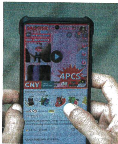
Energy Stick dijual dalam talian termasuk paparan grafik perbezaan paru-paru yang menjadi lebih bersih selepas menggunakan produk.

Malah, ada penjual yang menggunakan slogan 'Sedut dahulu,