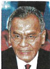
Dr Dzulkefly Ahmad

Justeru, PHM meminta supaya penjualan produk itu dihentikan segera.